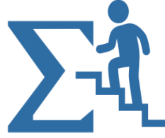
Toplamalı & Çok Adımlı Kampanya