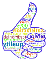
Hizmet Kalitesi Artışı